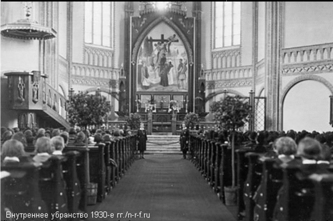
Внутреннее убранство 1930-е гг.

Выборг - это город, который был разрушен в 1944 году. Сейчас он восстанавливается, и это очень интересно.