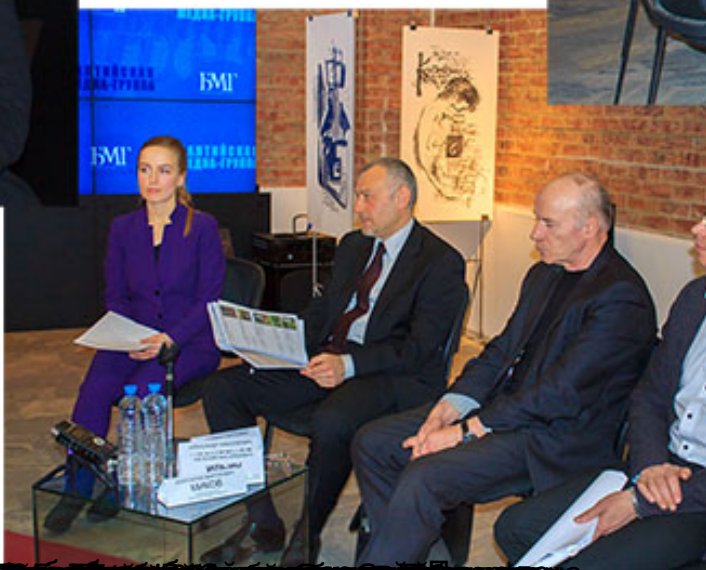
«Ветеран Петербург» 2 апреля 2015г.: Забытым героям нужны увлеченные люди